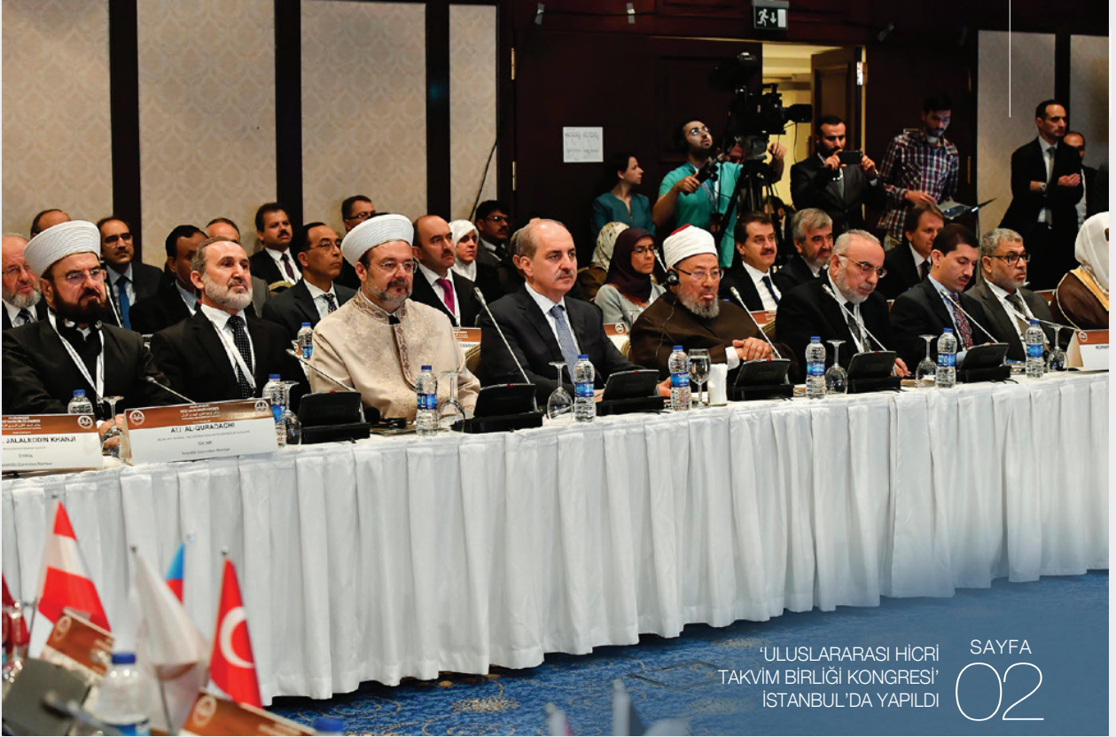
'ULUSLARARASI HİCRİ TAKVİM BİRLİĞİ KONGRESİ' İSTANBUL'DA YAPILDI