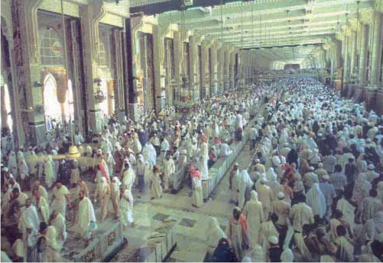
Mes'a'nın İçten Görünümü