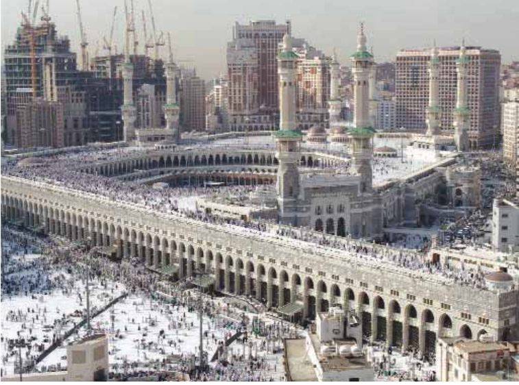
Mescid-i Haram, Ka'be ve Mes'a'nın dıştan genel görünümü