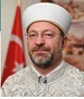
Prof. Dr. Ali ERBAŞ Diyaret İşleri Başkanı