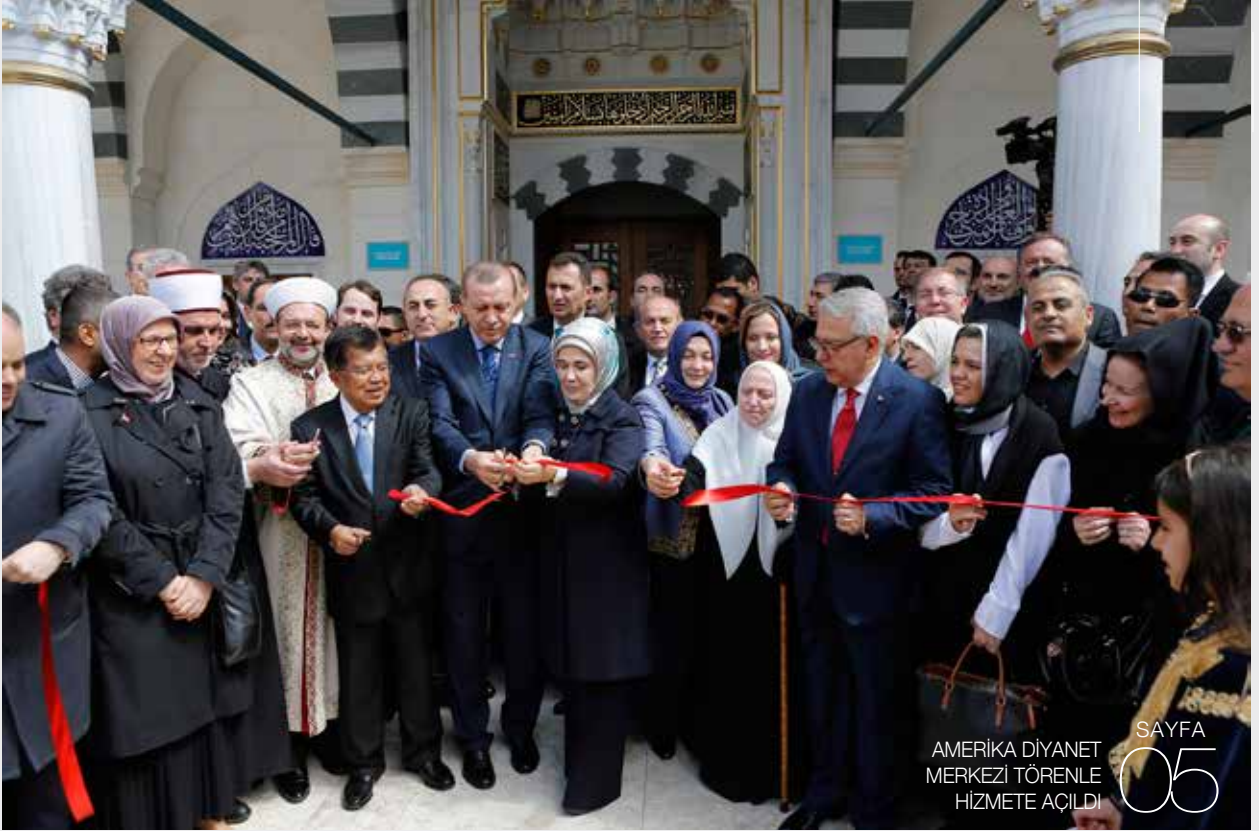
AMERİKA DIYANET MERKEZİ TÖRENLE HİZMETE AÇILDI