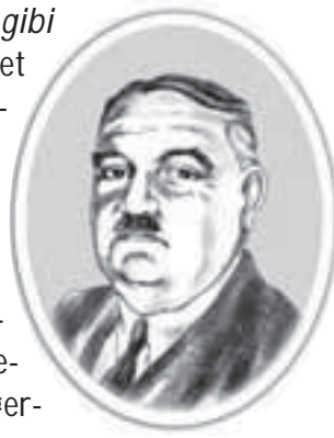
Yahya Kemal Beyatlı (1884-1958)

“Fikri ve duyguyu canlı bir şey gibi yaşamayı bilmiyoruz.” der, Ahmet Hamdi Tanpınar. Oysa duygu ve düşünceleri canlı bir şey gibi yaşamak insan için mükemmel bir tecrübe kaynağıdır. Çünkü ölüm duygusunda olduğu gibi. Ölüm duygusu, hayatın belli dönemlerinde sarsıcı bir şekilde yoklar insanı. Böylece yapıp ettiklerini veya yapmayı tasarladıklarının değerlendirme imkânı bulur. İnsan, bazen de yakınlarından veya sevdiklerinden