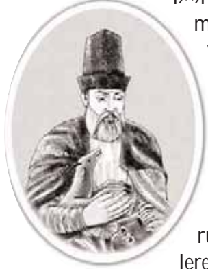
Hacı Bektaş Veli (1209-1271)

İnsanın bir millete mensup olması, belli bir hayat tarzının devralması ve onu geleceğe taşımasıdır. Çünkü hayat kesintisiz bir süreçtir.