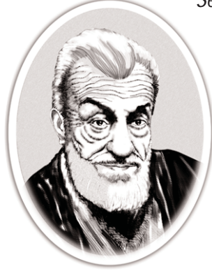
Necip Fazıl Kısakürek (1905-1983)

Seni korkutacak geçtiğin yollar, Arkandan gelecek hep ayak sesim. Sarıp vücudunu belirsiz kollar, Enseni yakacak ateş nefesim.