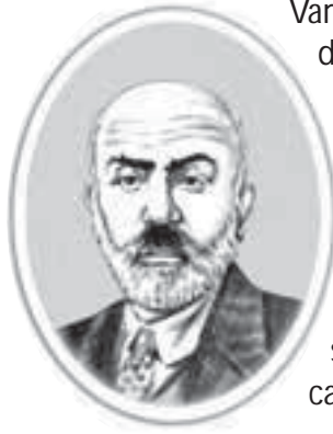
Mehmet Akif Ersoy (1873-1936)

Varlıkların sınırlarını doldurmak ve sınırdanlık aşmak isteyen bir insan, buradaki huzuru bilince, sınırsız sevgiye dönüştürmeyi başarmalıdır.